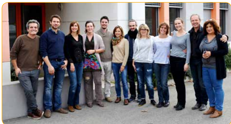
L'équipe de l'hôpital de jour enfant, l'Oranger, Fourchon, Arles

Face à une période de la vie critique et tourmentée, la création de cette unité spécifique a pour objectif de proposer un espace de parole aux adolescents ainsi qu'à leurs familles. Trois journées par semaine sont consacrées à cet accueil, offrant un espace contenant et relationnel qui peut déboucher sur des prises en charge médico-psycho-sociales. Cela nécessite un travail de réseau prégnant, impliquant une optimisation de la coordination avec les divers acteurs médico-sociaux de la ville d'Arles. La mise en place d'une équipe mobile permet des interventions sur des lieux de crise tels que le service des Urgences mais aussi les collèges et lycées ainsi que dans les familles. Les adolescents sont également accueillis sur les CMP de Tarascon et de Saint Martin de Crau.