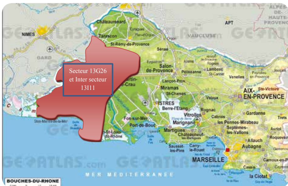
Localisation géographique des secteurs 13G26 / 13111 sur le département des Bouches-du-Rhône.