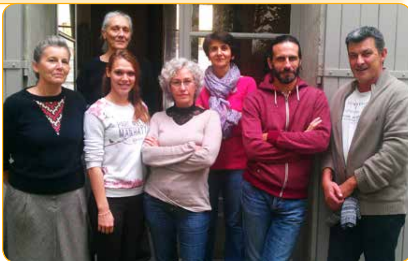
L'équipe du CATTTP d'Arles

Sur le même modèle que ceux d'Arles, les CMP et CATTTP existent à Saint Martin de Crau, Tarascon et Salin de Giraud.