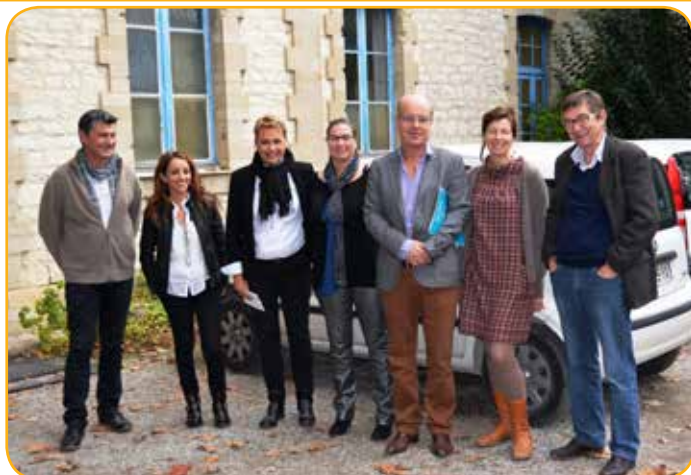
Equipe du CMP Trinquetaille, Arles

après midi. Des entretiens d'aide, de soutien et de réassurance individualisés peuvent être réalisés à tout moment. Il s'agit de dédramatiser le soin en psychiatrie pour mettre la personne en confiance et envisager une orientation vers d'autres intervenants (psychiatre, psychologue, assistante sociale) ou vers d'autres structures. La continuité et le maintien du lien est aussi une préoccupation dans le parcours du patient, des accompagnements étant réalisés pour de nombreuses démarches. Mais la mission du CMP est également de faciliter l'accès aux soins en réalisant un travail de prévention telle que la visite à domicile. Cette dernière permet de vérifier l'adaptabilité du patient à son environnement, de réaliser un soutien et un accompagnement dans les démarches d'inscription de la personne dans la Cité et de vérifier l'observance des traitements.