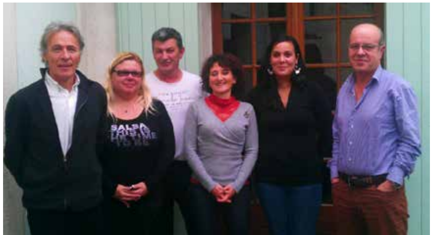
Equipe de l'hôpital de jour adulte, rue Lacroix, Arles.

La mission de soin de l'hôpital de jour vise à accéder ou renforcer l'autonomisation des patients mais aussi à lutter contre la désinsertion sociale et l'isolement que peuvent engendrer les pathologies psychiatriques chroniques.