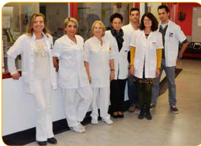
L'équipe du court séjour psychiatrique et du CAPEP, 4ème Nord

Sur le même modèle que ceux d'Arles, des CMP et CATTP existent à Saint Martin de Crau, Tarascon et Salin de Giraud.