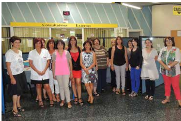
L'équipe des Admissions hospitalières

Les recettes de l'établissement, et donc le niveau de ses moyens, sont impactées par la qualité de la gestion du cycle admission-facturation qui concerne l'ensemble de l'établissement, mais débute et finit dans ce service.